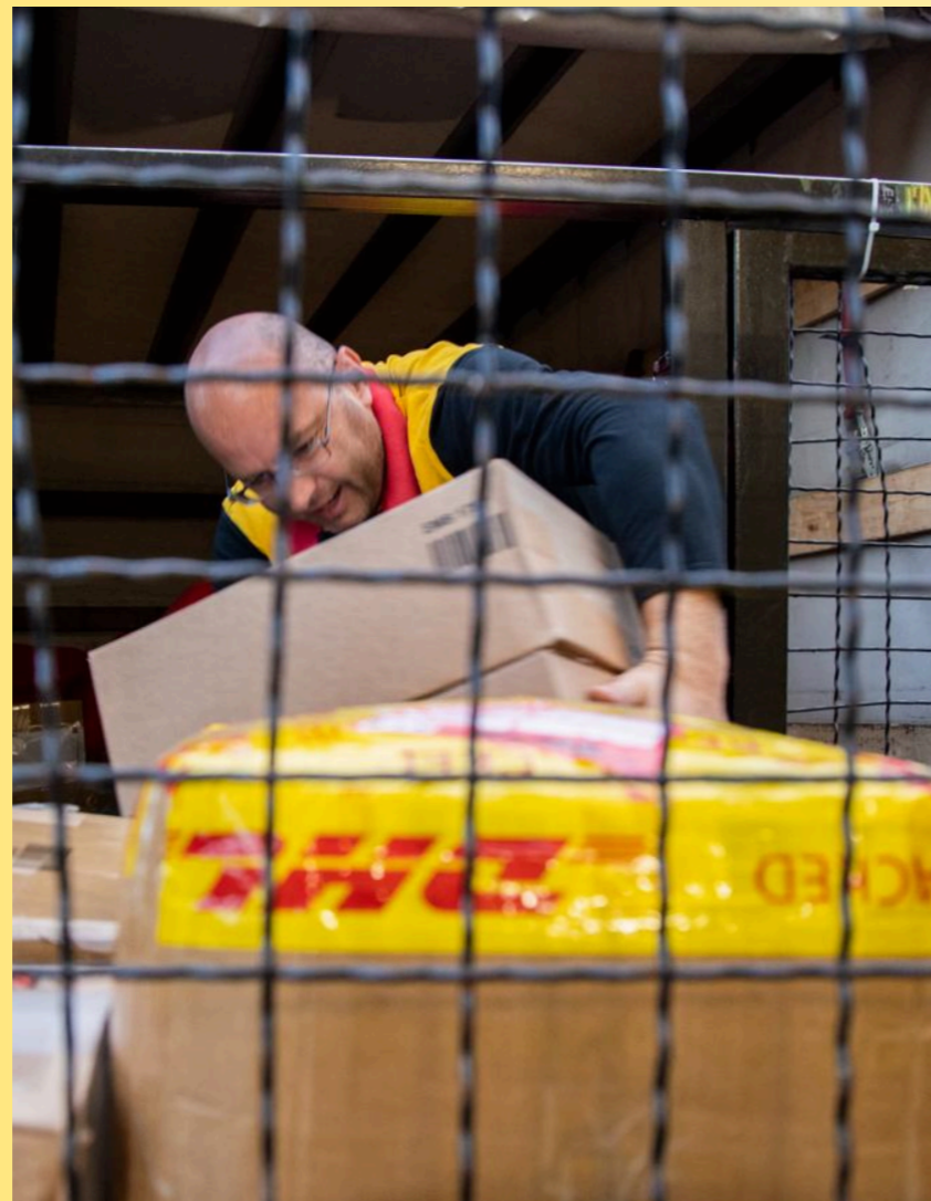
PS / 29.4. Bild wenn möglich fixiert

Die GIZ ist seit 2026 auch direkter Umsetzungspartner für die Trade Facilitation Agreement Facility. Darüber können wir kleinere Reformprojekte für das Abkommen finanzieren. Derzeit arbeiten wir hier in Kenia, Kirgisistan und Madagaskar mit der GIZ zusammen.